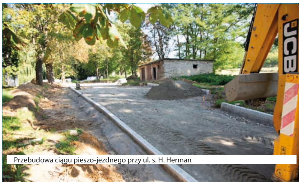
Przebudowa ciągu pieszo-jezdnego przy ul. s. H. Herman