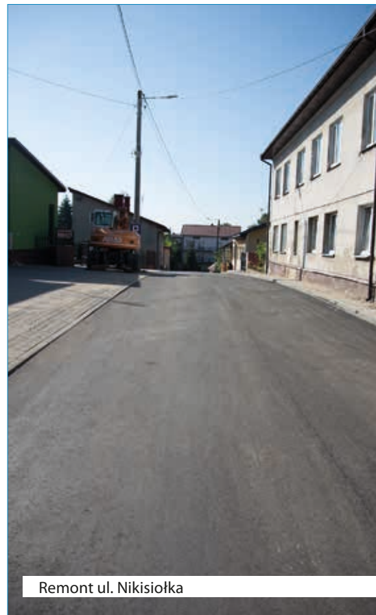
Remont ul. Nikisiołka