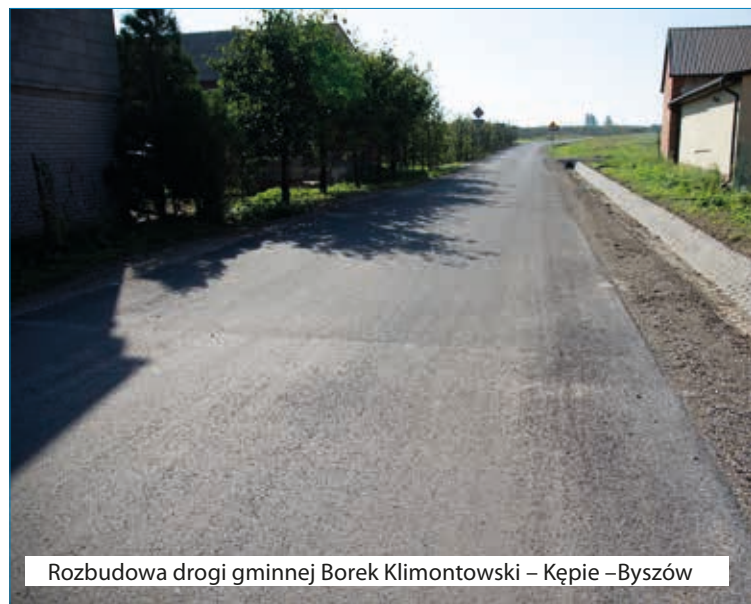
Rozbudowa drogi gminnej Borek Klimontowski – Kępie –Byszów