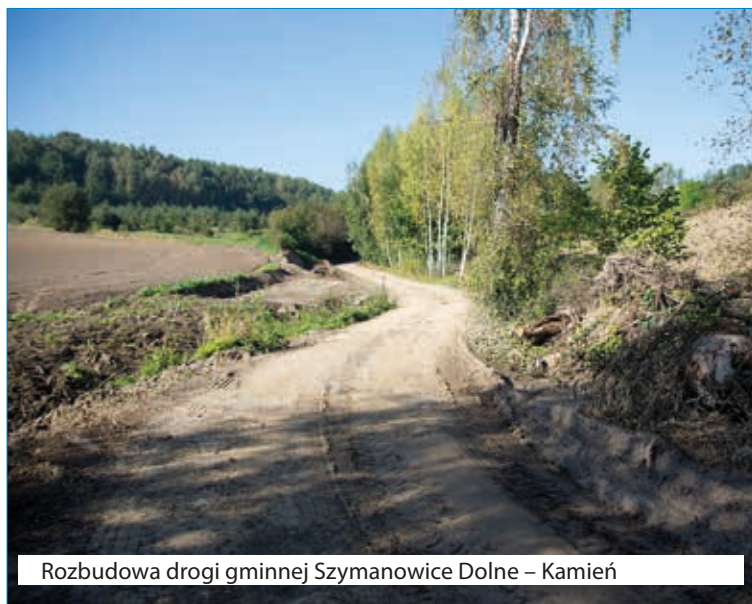
Rozbudowa drogi gminnej Szymanowice Dolne – Kamień