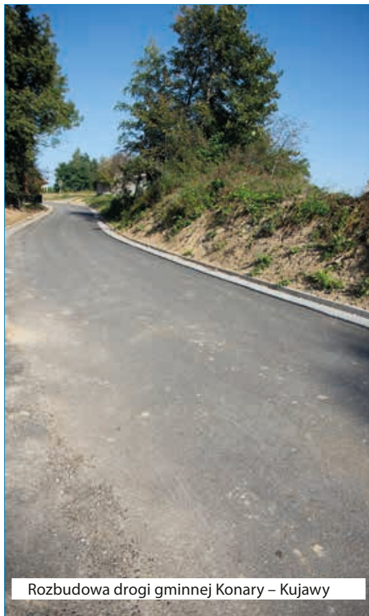
Rozbudowa drogi gminnej Konary – Kujawy