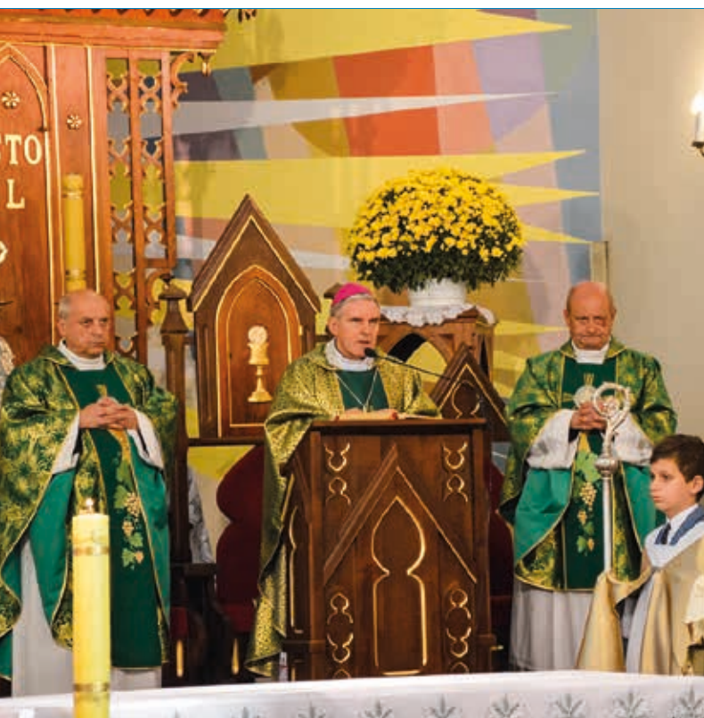
FOT. MIKOŁAJ FOCH