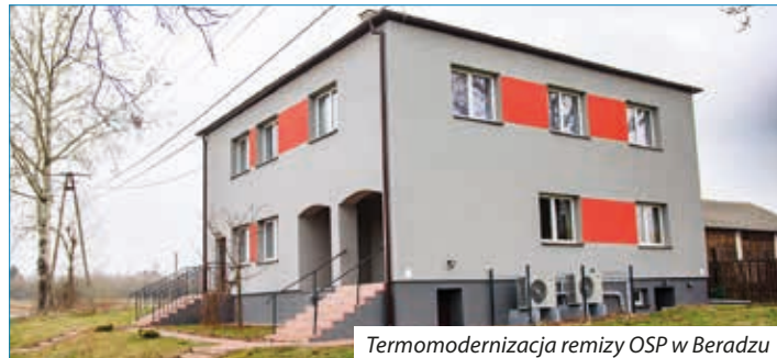
Termomodernizacja remizy OSP w Beradzu

Projekt współfinansowany z Europejskiego Funduszu Rozwoju Regionalnego w ramach Działania 3.3 „ Poprawa efektywności energetycznej w sektorze publicznym i mieszkaniowym ” Osi 3 „ Efektywna i zielona energia ” Regionalnego Programu Operacyjnego Województwa Świętokrzyskiego na lata 2014-2020 przy dofinansowaniu w kwocie ok. 5 531 224,83 zł. Wartość projektu ogółem 7 049 697,76 zł.