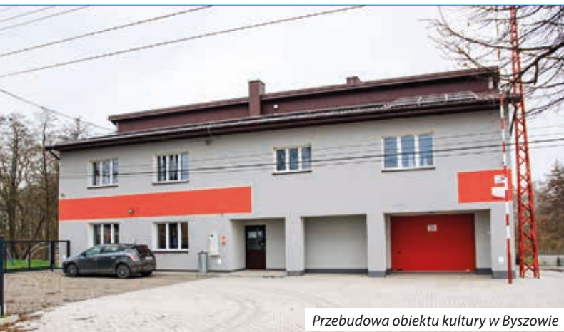
Przebudowa obiektu kultury w Byszowie

⊙ Zadanie – Gmina Klimontów od 11.07.2023 r. do 30.11.2023 r. realizowała projekt pn. „ Wsparcie funkcjonalności obszarów wiejskich poprzez wyposażenie i doposażenie obiektów publicznych pełniących funkcje społeczno-kulturalne ” w ramach konkursu pn. „ Wsparcie funkcjonalności obszarów wiejskich ” finansowanego z budżetu Województwa Świętokrzyskiego. Umowa dotacji nr 47/ROW/2023.