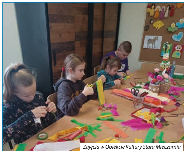
Zajęcia w Obiekcie Kultury Stara Mleczarnia

Zajęcia skierowane są do wszystkich mieszkańców gminy: dzieci, młodzieży, dorosłych, seniorów prowadzone przez opiekunów obiektów. Zachęcamy do korzystania z stworzonych miejsc, w których możemy rozwijać swoje pasje, dzieci mogą odrabiać lekcje szkolne oraz możemy zgłaszać swoje propozycje zajęć. Naszym celem jest prowadzenie zajęć rozwijających ćwiczenie prostego i logicznego myślenia, pomoc w rozwijaniu umiejętności planowania i rozwiązywania problemów.