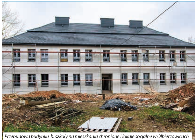
Przebudowa budynku b. szkoły na mieszkania chronione i lokale socjalne w Olbierzowicach

☉ W ramach otrzymanej promesy z Rządowego Funduszu Polski Ład: Program Inwestycji Strategicznych rozpoczęliśmy realizację zadania pn. „Przebudowa wraz ze zmianą sposobu użytkowania budynku byłej szkoły podstawowej na mieszkania chronione i lokale socjalne w Olbierzowicach” . Zadanie obejmuje przebudowę budynku byłej szkoły podstawowej na mieszkania chronione i lokale socjalne, przez dostosowanie budynku do nowej funkcji użytkowej i bezpieczeństwa użytkownika wydzielając nowe pomieszczenia wraz z robotami dodatkowymi tj. w zakresie burzenia i rozbiórki, izolacji przeciwwilgociowej ścian fundamentowych, robót murowych, dachu konstrukcji i pokrycia, podłoża i posadzki, tynki i okładziny, stolarka okienna i drzwiowa zewnętrzna i wewnętrzna, malowanie, elewacja, instalacje: wod-kan, c.o., gaz, kotłownia, instalacja elektryczna, odgromowa, wentylacja, przyłącz: wody, kanalizacji, gazu, ogrodzenie zbiorników, wiata śmietnikowa, oświetlenie, utwardzenie terenu-droga, miejsca postojowe, chodniki, podjazd, opaska, ogrodzenie, instalacja fotowoltaiczna. Powstanie 13 lokali mieszkalnych o pow. od 25,12 m 2 do 53,5 m 2 , tj. mieszkanie 2 pokojowe + kuchnia i łazienka 12 szt., 3 pokojowe + kuchnia i łazienka 1 szt. Wartość inwestycji: 4 285 999,44 zł, kwota wnioskowanych środków: 3 643 099,52 zł. Przewidywany termin zakończenia inwestycji to styczeń 2025 r.