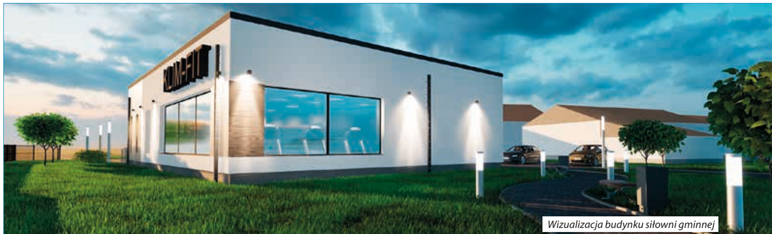
Wizualizacja budynku siłowni gminnej

Teren inwestycji posiada bezpieczny dostęp do istniejącego układu komunikacyjnego – drogi publicznej. Projektowany budynek dostosowany zostanie również dla potrzeb osób niepełnosprawnych. Dostęp do budynku odbywał się będzie za pośrednictwem pochylni dla osób niepełnosprawnych. Przewidywany koszt ogólny zadania to 4 000 000,00 zł.