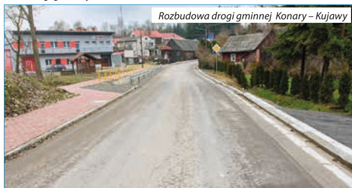
Rozbudowa drogi gminnej Konary – Kujawy