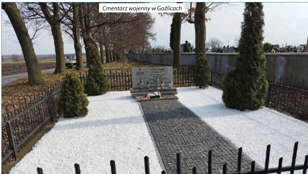
Cmentarz wojenny w Goźlicach