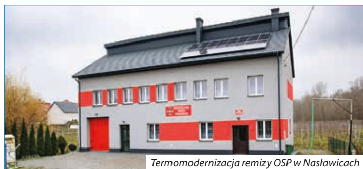
Termomodernizacja remizy OSP w Nasławicach