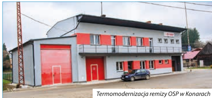
Termomodernizacja remizy OSP w Konarach