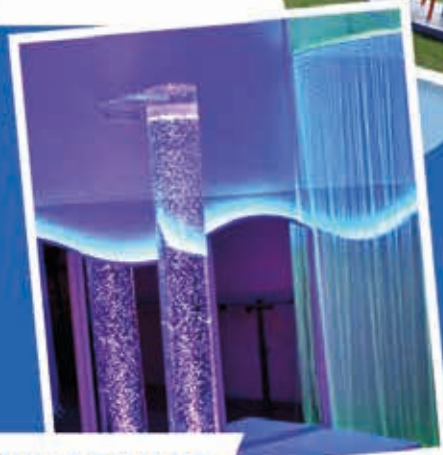
SALA DOŚWIADCZANIA ŚWIATA