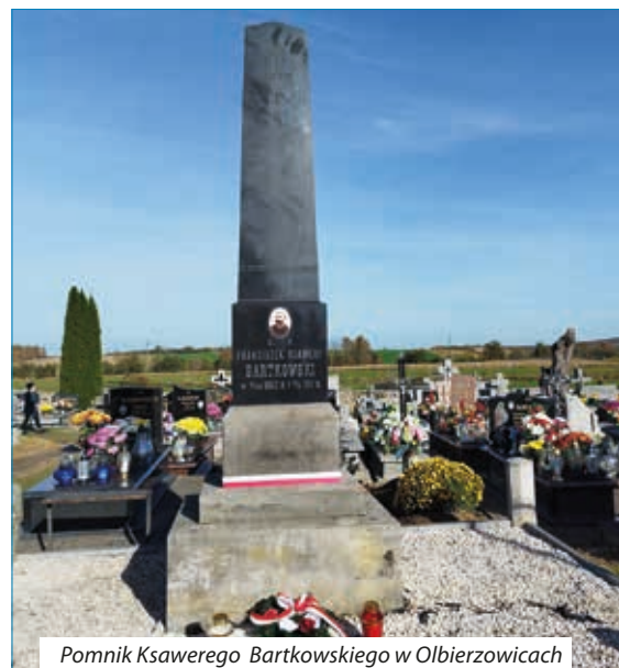
Pomnik Ksawerego Bartkowskiego w Olbierzowicach