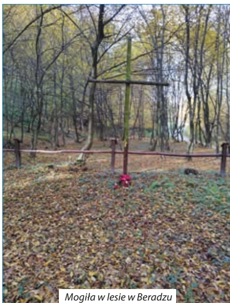
Mogiła w lesie w Beradzu