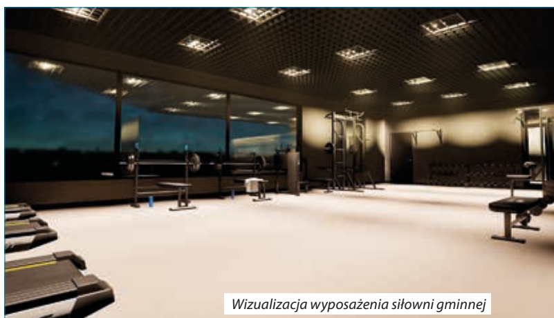
Wizualizacja wyposażenia siłowni gminnej

☉ Gmina Klimontów otrzymała 392 000,00 zł na zrealizowanie zadania inwestycyjnego pn. „ Modernizacja zabytkowej kamienicy w Klimontowie poprzez przeprowadzenie prac budowlanych ”, w ramach dofinansowania inwestycji z Rządowego Funduszu Polski Ład: Programu Odbudowy Zabytków.